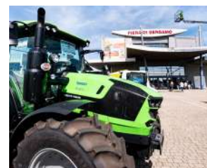
MACCHINARI E TECNOLOGIE