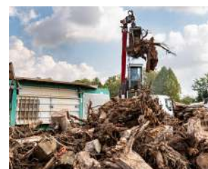
BOSCO - LEGNO - ENERGIA